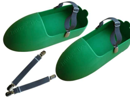
Chauss' & Clip Pro