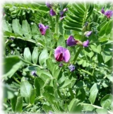
Vesce de Printemps