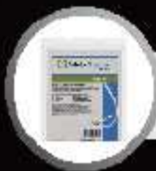
LN3009 : le blister de 4 cartouches