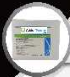
Carton de 5 blisters

1 Cartouche de 30 g ou 1 blister de 4 cartouches de 30 g