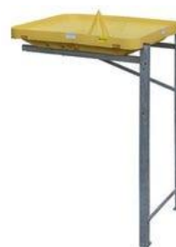
Unité secondaire (extension) pour un big-bag avec un fond plat par exemple