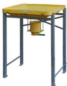
Unité principale pour un big-bag avec une goulotte de vidange