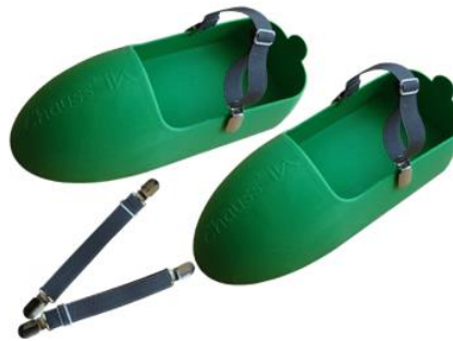
Chauss' & Clip Pro